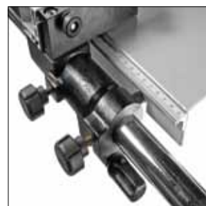
Pila stolní kotoučová PROTECO SKP-250-230-P pr. 250mm, 230V, s pojezdovým vozíkem obj. č. 51.01-SKP-250-230-P