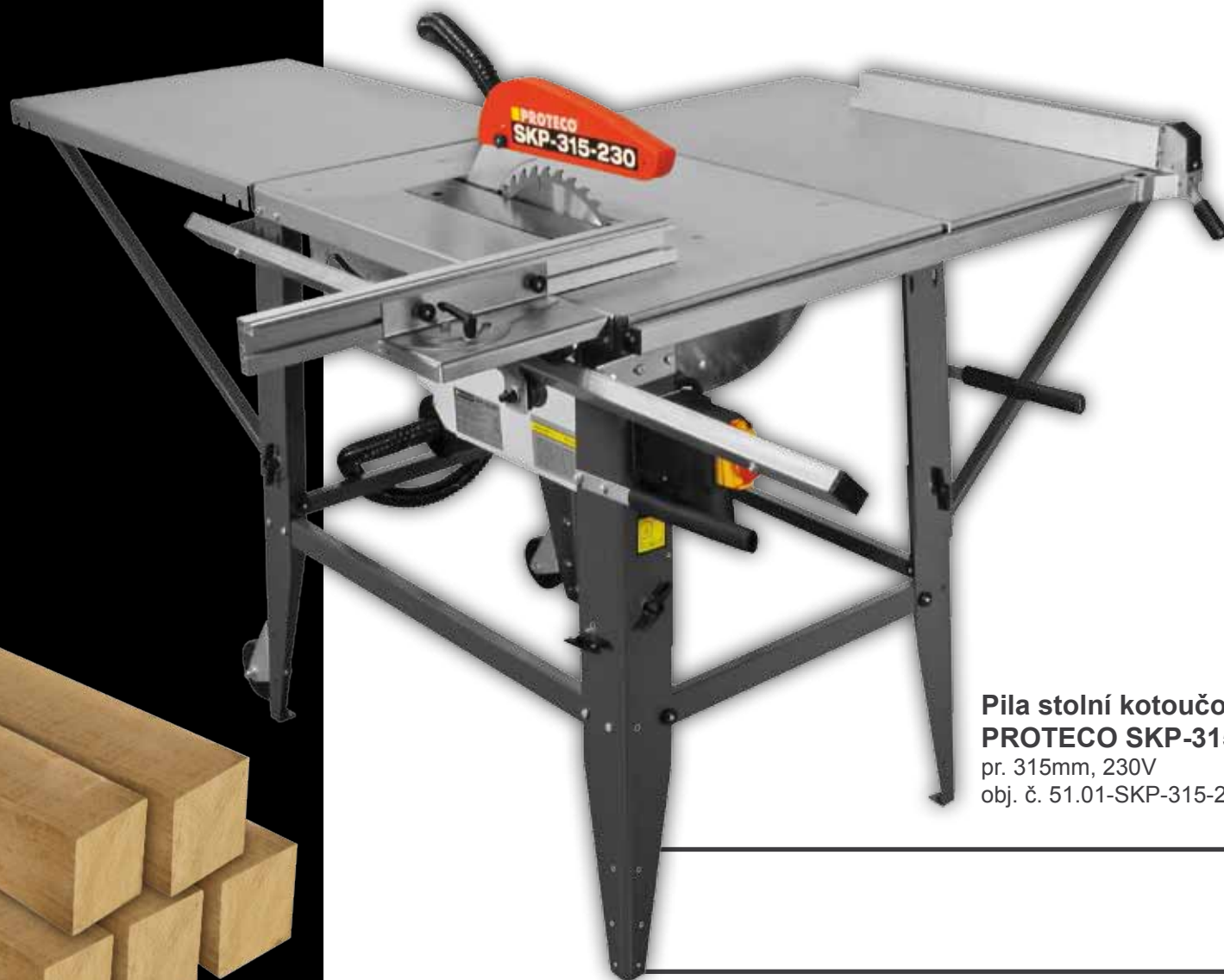
Pila stolní kotoučová PROTECO SKP-315-230 pr. 315mm, 230V obj. č. 51.01-SKP-315-230