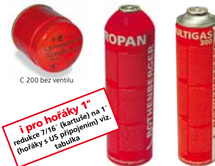
C 200 bez ventilu

i pro hořáky 1" redukce 7/16" (kartuše) na 1" (hořáky s US připojením) viz. tabulka