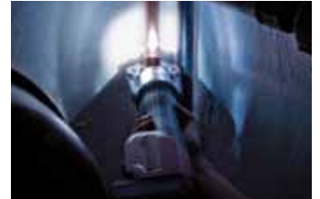
LED osvětlení pracovní pozice